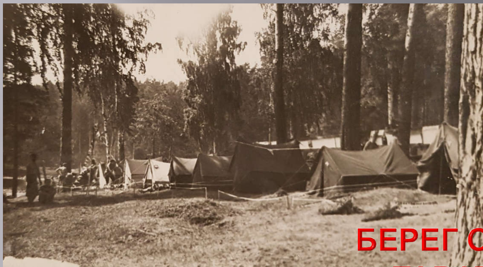
БЕРЕГ ОЗЕРА ТАВАТУЙ