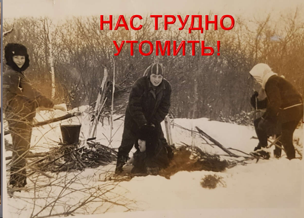
НАС ТРУДНО УТОМИТЬ!