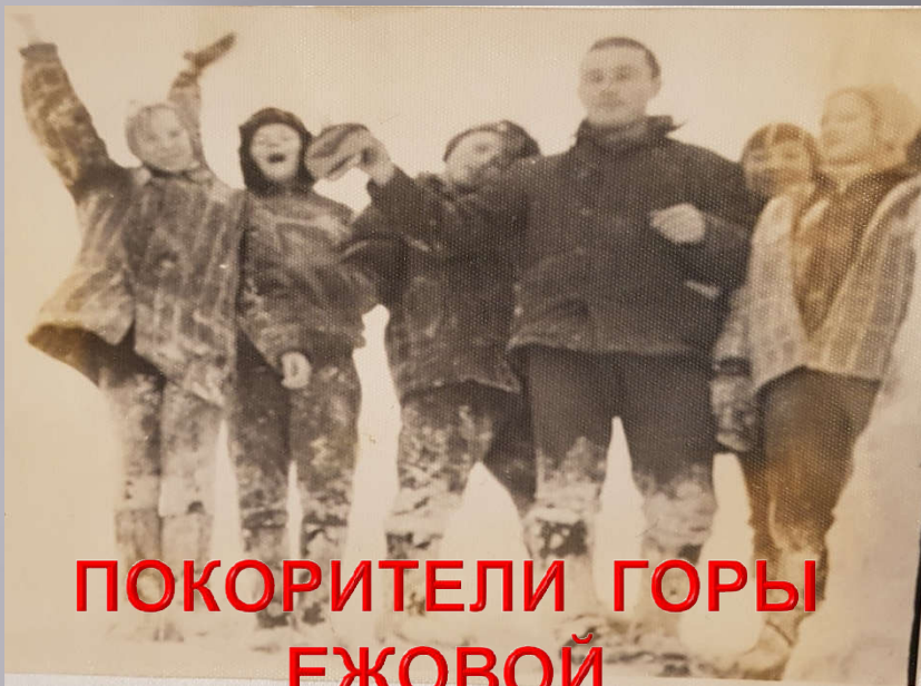
ПОКОРИТЕЛИ ГОРЫ ЕЖОВОЙ